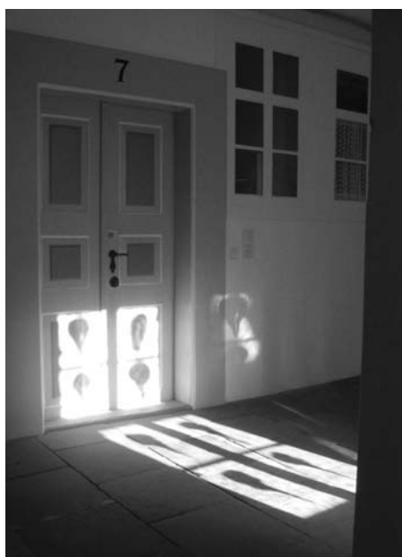
Spiegelung der Glasmalereien im Kreuzgang des Klosters Mariensee

Auch der Innenhof gehört damit nicht wie klassischerweise zur Klausur, sondern ist eine Art Verlängerung des Kreuzgangs nach außen. Weil jede Wohneinheit vom Kreuzgang aus separat zu begehen ist und einen eigenen Garten hat, betrachten wir diese als Rückzugsort für das jeweilige Konventsmitglied: als persönliche Klausur. Daneben wurde in der Abtei, dem heute als Empfangs- und Begegnungsraum genutzten Bereich der Äbtissin, ein Konventsraum eingerichtet. An einer